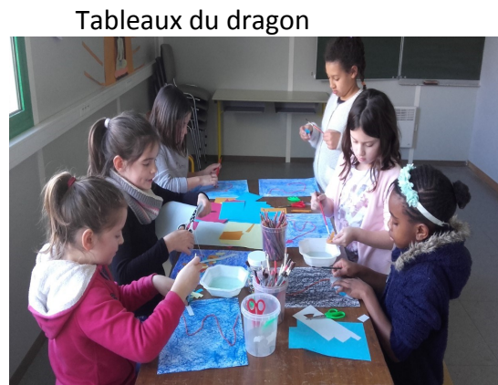
Tableaux du dragon