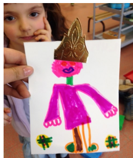
Roi et Reine