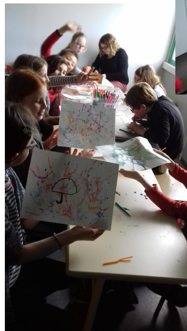
Peinture à la paille