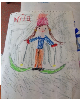
Dessins d'hiver à la craie grasse