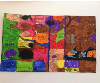
Arbres de vie « A la manière de GUSTAV KLIMT »