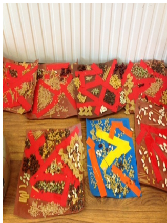
Tableaux de graines